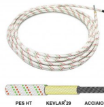
FES HT KEVLAR ® 29 ACCIAIO